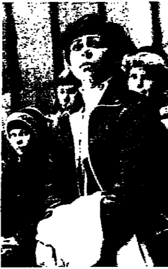
ايرينارو دينتا (توفوسية)